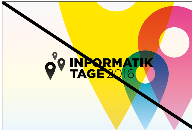
Falsche Logo-Version / Richtig: ohne Pin-Zusatz