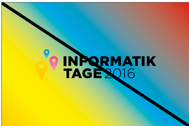
Farbige Logo Version auf farbigem Hintergrund