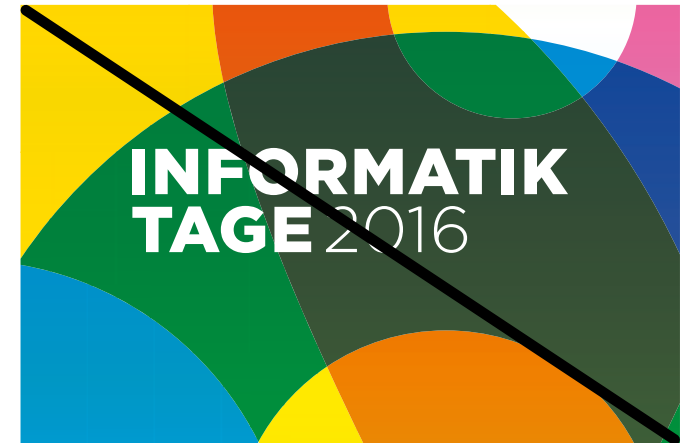
Falsche Logo-Version / Richtig: mit Pin-Zusatz